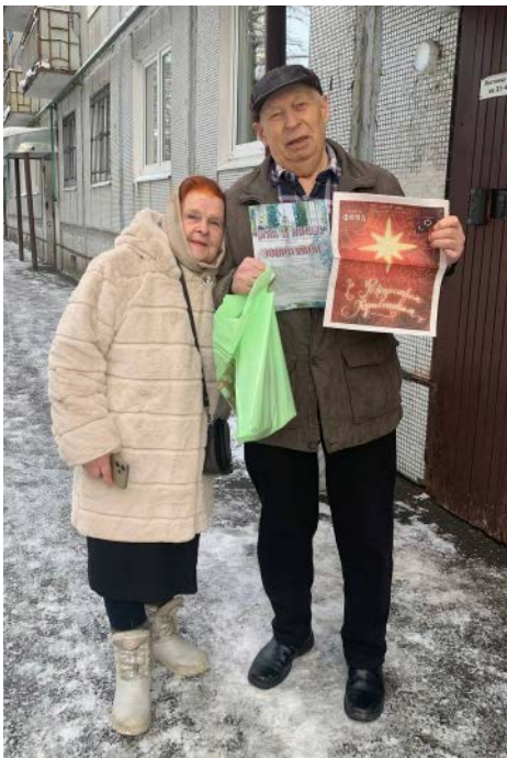
Рождественские подарки для «Общества Блокадников»