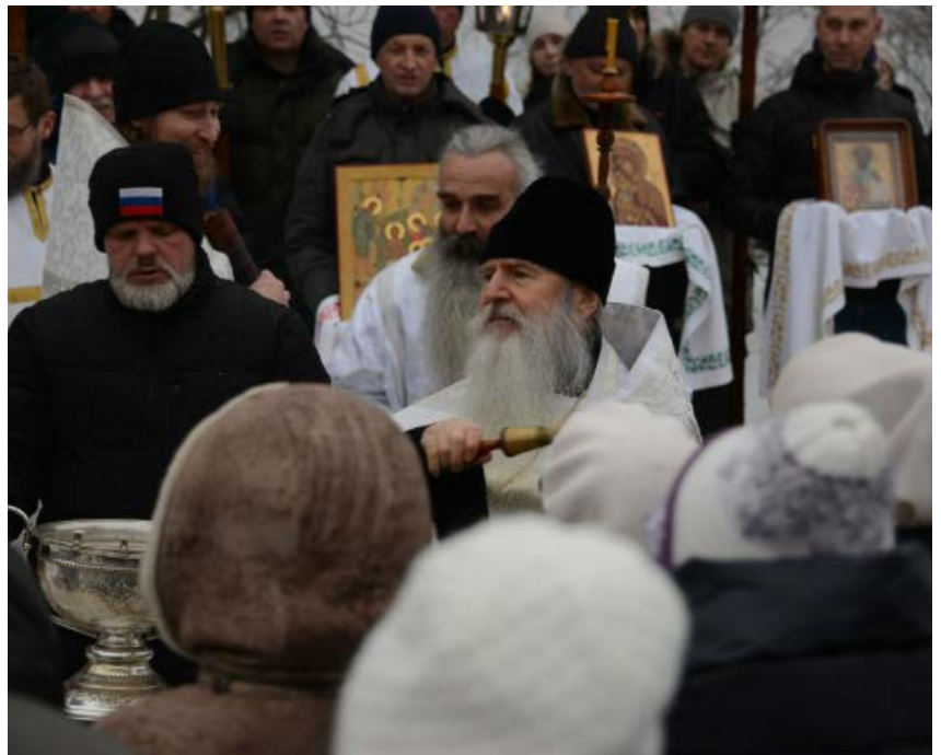
Крещение Господне Крестный ход, освящение воды, 2026 год