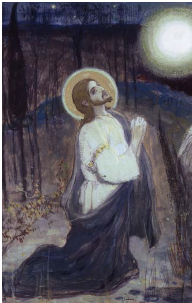
М. В. Нестеров. «Моление о чаше»

В саду Гефсиманском стоял Он один, Предсмертную мукой томимый. Отцу Всеблагому в тоске нестерпимой Молился страдающий Сын. «Когда-то возможно, Пусть, Отче, минует Мя чаша сия, Однако да сбудется воля Твоя...» И шёл Он к апостолам с думой тревожной, Но, скованы тяжкой дремой, Апостолы спали под тенью оливы, И тихо сказал Он им: «Как не могли вы Единого часа побдети со Мной? Молитесь! Плоть немощна ваша!..» И шёл Он молиться опять: «Но если не может Меня миновать — Не пить чтоб её — эта чаша, Пусть будет, как хочешь Ты, Отче!» И вновь Объял Его ужас смертельный, И пот Его падал на землю, как кровь, И ждал Он в тоске беспредельной. И снова к апостолам Он подходил, Но спали апостолы сном непробудным, И те же слова Он Отцу говорил, И пал на лицо, и скорбел, и тужил, Смущаясь в борении трудном!.. О, если б я мог В саду Гефсиманском явиться с мольбами, И видеть следы от Божественных ног, И жгучими плакать слезами! О, если б я мог Упасть на холодный песок И землю лобзать ту святую, Где так одиноко страдала Любовь, Где пот от лица Его падал, как кровь, Где чашу Он ждал роковую! О если б в ту ночь кто-нибудь, В ту страшную ночь искупленья, Страдальцу в изнывшую грудь Влил слово одно утешенья!