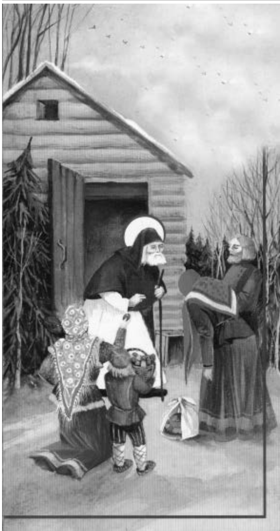
Фрагменты открыток Ольги Бондарь

Получив благословение, все богомольцы стали вокруг старца почтительным полукругом. Большинство крестьянок были повязаны в знак траура белыми платками. Дочь старой нашей няни, недавно умершей от холеры, тихо плакала, закрыв лицо передником.