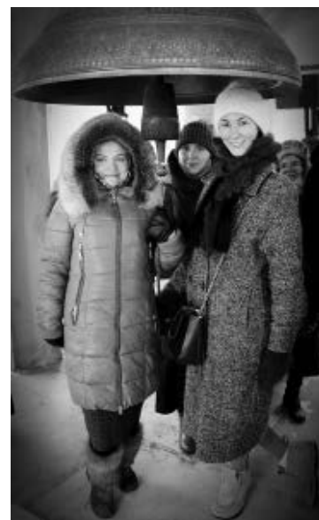
23 февраля состоялась паломническая поездка в Старую Ладугу, посвящённая десятилетию молодёжного клуба