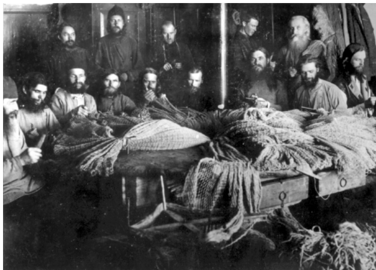
Репрессированное духовенство. Соловки

Сохранилась еще одна маленькая церковь за монастырской оградой. Последним монахам Соловецкого монастыря приказано покинуть остров в 1929 году; до этого срока они должны показать заключенным, как надо ловить и сушить сельдь. Эта кладбищенская церковь была им пока оставлена.