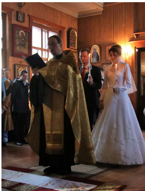
Венчание дочери Наташи в храме прп. Серафима Саровского