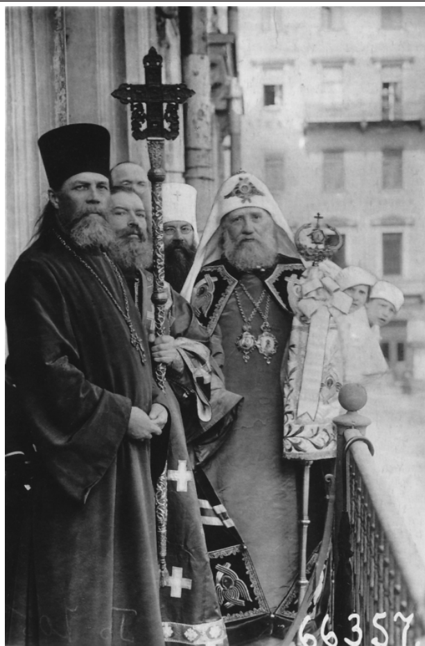
Святитель Тихон (Белавин), патриарх Московский и всея Руси, священномученик Вениамин (Казанский), митрополит Петроградский и Гдовский, священномученик Философ (Орнатский)

Ещё несколько лет монастырскому Приходскому совету удавалось сохранить единство. Отец Иоанн Орнатский писал: «...церковно-приходской совет, женский монастырь и верующие миряне