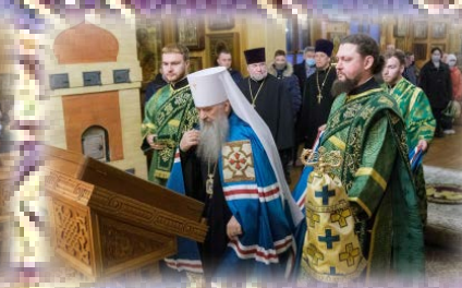
Летопись храма (стр. 12–13)