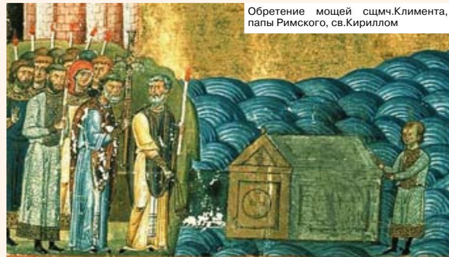
Обретение мощей сщмч.Климента, папы Римского, св.Кириллом

Ситуация, однако, не столь проста, как кажется. При всём старании, автору данного сообщения не удалось найти святоотеческие и агиографические контексты, где «λείψα» непосредственно сопоставлялись с «δύναμις», например, в гипотетических выражениях типа «λείψα τῆσθε δύναμις», т.е. «мощи совершают силы». В немногочислен-