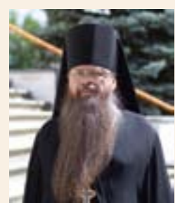
М-рь св. Пантелеимона

Наместник Данилова ставропигиального мужского монастыря архиепископ Алексий (Поликарпов) дал интервью порталу Синодального отдела по монастырям и монашеству после посещения в конце мая 2016 года в составе делегации Святейшего Патриарха Московского и всея Руси Кирилла Святой Горы Афон.