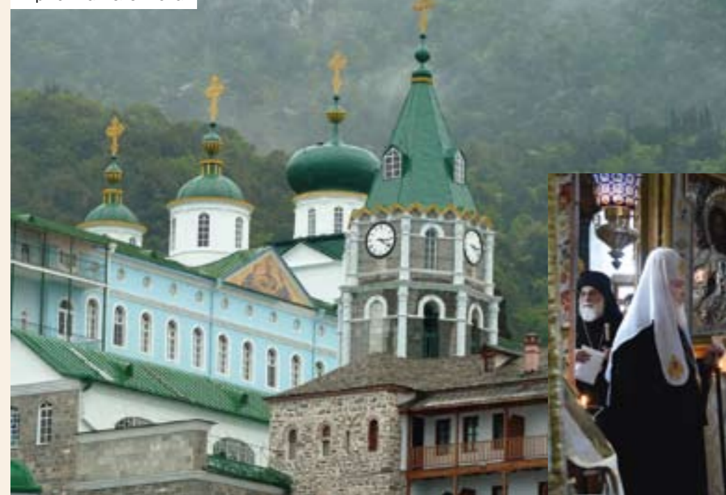
М-рь св. Пантелеимона

населников, пожелавших поделиться своими размышлениями о монашестве с нашими соотечественниками. Словно незримая ниточка протянулась между Афоном и Россией: Святейший Патриарх Кирилл — на Святой Горе Афон, а самые известные афонские духовники — в уральской столице. Наши связи с афонитами становятся всё крепче. Скажите, нам по-прежнему есть чему учиться у Афона?