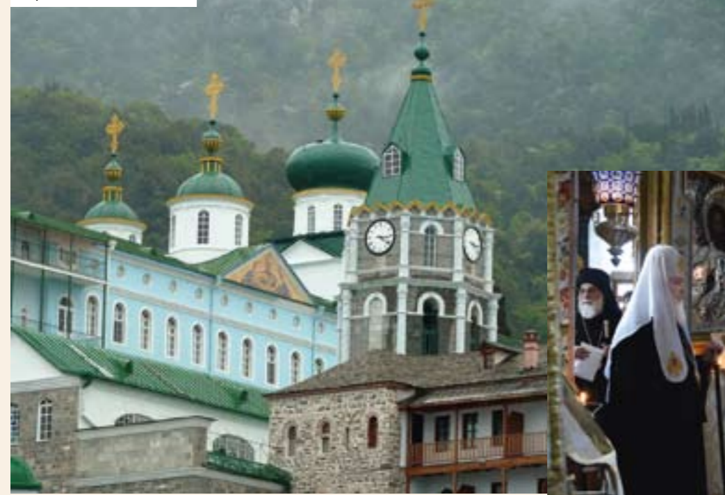
М-рь св. Пантелеимона

населников, пожелавших поделиться своими размышлениями о монашестве с нашими соотечественниками. Словно незримая ниточка протянулась между Афоном и Россией: Святейший Патриарх Кирилл — на Святой Горе Афон, а самые известные афонские духовники — в уральской столице. Наши связи с афонитами становятся всё крепче. Скажите, нам по-прежнему есть чему учиться у Афона?